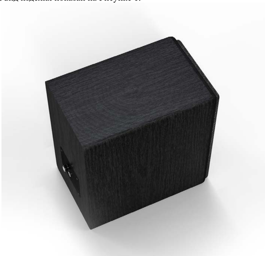
Рисунок 1 - Внешний вид изделия

1.2.1. Внешний вид изделия показан на Рисунке 1.